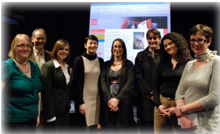
Tîm WRN gyda chydweithwyr o'r Llyfrgell Genedlaethol yn lansiad cynllun Corlannu Traethodau Cymru

Gan wneud defnydd o arbenigedd canolog y tîm prosiect mewn metadata a hawlfraint, crewyd Biwro Adneuo Cyfryngol (MDB) gyda'r bwriad o ymchwilio i'r effaith ar wasanaethau Adennill Gwybodaeth (IR) pe rhoddid y gwaith o gynnal cronfa adneuo i ffynhonnell allanol. Trwy gydweithio â rhai o bartneriaid WRN, cymerodd y tîm gyfrifoldeb dros adneuo nifer o gasgliadau penodol.