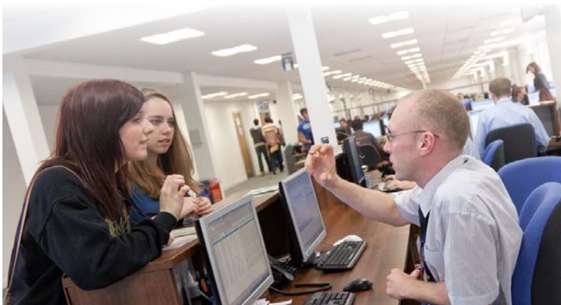
Cymorth TG yng Nghanolfan Addysgu Athrofa Prifysgol Cymru Caerdydd, Llandaf

Mae gallu ymchwilyr i drin gwybodaeth hefyd yn holl bwysig. Ym mis Rhagfyr 2010, comisiynodd y Rhwydwaith Gwybodaeth Ymchwil (RIN) astudiaeth yn archwilio lle a rôl