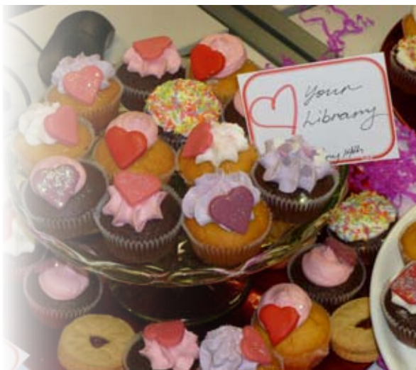
Caru eich Llyfrgell ym Mhrifysgol Abertawe

Mae llawer o lyfrgelloedd hefyd ar agor i aelodau o'r cyhoedd eu defnyddio, a lluniwyd nifer o bartneriaethau rhanbarthol i ganiatáu benthyca ar y cyd rhwng y gwahanol lyfrgelloedd. Eisoes mae gan fyfyrwyr yng Nghymru, fel pob dinesydd arall, hawl i gael mynediad electronig yn rhad ac am ddim i Lyfrgell Genedlaethol Cymru; mae'r Llyfrgell yn gweithio'n ddiwyd i droi'r hawl hwn yn ddefnydd go iawn, gyda chymorth cytundebau â llyfrgelloedd lleol i greu aelodaeth awtomatig.