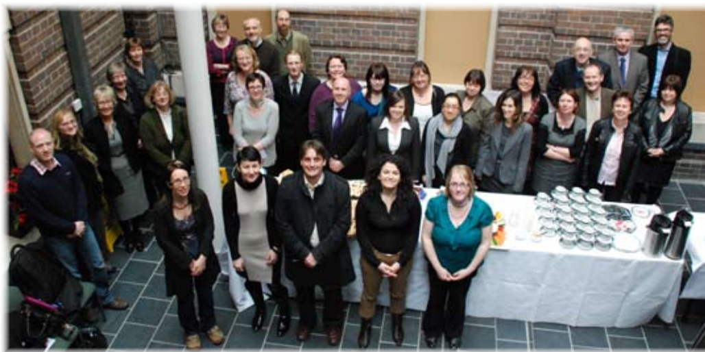
Aelodau o'r WRN gyda chydweithwyr o'r Llyfrgell Genedlaethol, y Llyfrgell Brydeinig a WHELP yn lansiad cynllun Corlannu Traethodau Cymru

Llwyddodd consortiwm WRN yn eu cais am ariannu pellach gan JISC. Bu prosiect AEIOU Cymru (Data Gweithgaredd i Gyfoethogi a Chynyddu Defnydd Mynediad-agored) yn rhedeg am chwe mis, ac fe'i cwblhawyd ym mis Gorffennaf 2011. Nod y prosiect oedd cynyddu amlygrwydd a defnydd yr holl ymchwil academiaidd trwy gyfuno data gweithgaredd cronfeydd sefydliadau Cymreig i ddarparu gwasanaeth argymell 'yn aml yn cael eu harchwilio gyda'i gilydd' megis y rhai a ddefnyddir gan Amazon. Roedd y gwasanaeth yn anelu at hyrwyddo'r berthynas rhwng grwpiau ymchwil rhyng-sefydliadol o fewn Cymru.