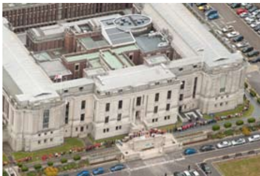
Dathlu canmlwyddiant gosod carreg sylfaen y Llyfrgell trwy ffurfio cadwyn ddynol o amgylch yr adeilad (15 Gorffennaf 2011)