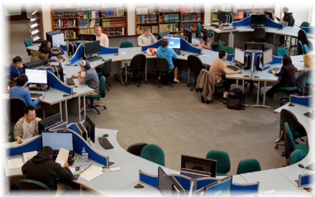
Neuadd Astudio Llyfrgell Prifysgol Abertawe