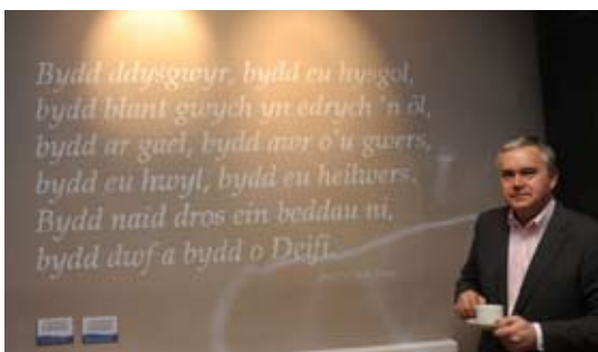
Hoffi Coffi, caffi Cymreig Prifysgol Abertawe, a lansiwyd yn swyddogol gan Huw Edwards, y newyddiadurwr a'r darlledwr

Parhaodd llyfrgelloedd academiaidd yng Nghymru â'r gwaith o adnewyddu eu hadeiladau a gwella eu cyfleusterau er mwyn rhoi'r profiad gorau posibl i fyfyrwyr yn ystod cyfnod eu hastudiaethau. Ymhlith y rhain roedd Cronfa Ymchwil wrth-gefn newydd a gofodau dysgu ar y cyd ym Mhrifysgol Bangor, a gofodau astudio ychwanegol ym Mhrifysgol Abertawe. Ym mis Mawrth, lansiwyd Hoffi Coffi, caffi Cymreig newydd Prifysgol Abertawe, gan y darlledwr Huw Edwards, ac ar 23