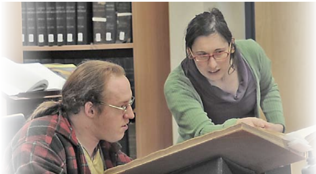
Myfyrwyr yn ymchwilio i hanes archwiliad archaeolegol Herculaneum a Pompeii, yn Llyfrgell ac Archifau Roderic Bowen, Prifysgol Cymru y Drindod Dewi Sant

Ymatebodd WHELP i'r ymgynghoriad hwn er mwyn tanlinellu gwerth y dreftadaeth ddogfennol, llawer ohoni'n cael ei chadw mewn archifau a chasgliadau llyfrgell mewn llyfrgelloedd cenedlaethol a phrifysgolion. Mae'r casgliadau arbennig hyn o werth hanesyddol parhaol, ond mae angen gweithredu i sicrhau eu bod yn cael eu cadw a'u bod yn hygyrch ar gyfer cenedlaethau'r dyfodol.