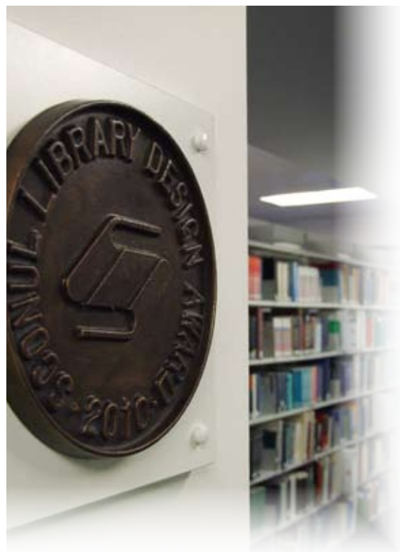
Gwobr a enillwyd gan Lyfrgell Trevithick, Prifysgol Caerdydd, yng nghystadlaeth Gwobrau Cynllunio Llyfrgelloedd SCONUL

Mae CyMAL: Amgueddfeydd, Archifau a Llyfrgelloedd Cymru wedi dechrau paratoi strategaeth newydd ar gyfer y tair blynedd nesaf, sef Llyfrgelloedd yn Ysbrydoli: Fframwaith strategol drafft ar gyfer datblygu llyfrgelloedd Cymru 2012–2015 . Barn CyMAL yw fod llyfrgelloedd cyhoeddus, llyfrgelloedd addysg a llyfrgelloedd mewn gweithleoedd wrth wraidd eu cymunedau. Y rheswm dros eu bodolaeth yw eu bod yn ysbrydoli ac yn helpu pobl i wneud gwahaniaeth cadarnhaol i'w bywydau. Chwaraeodd WHELF ran bwysig yn yr ymgynghoriadau, ac edrychwn ymlaen at weithio mewn partneriaeth gyda CyMAL i gyflawni nifer o flaenoriaethau.