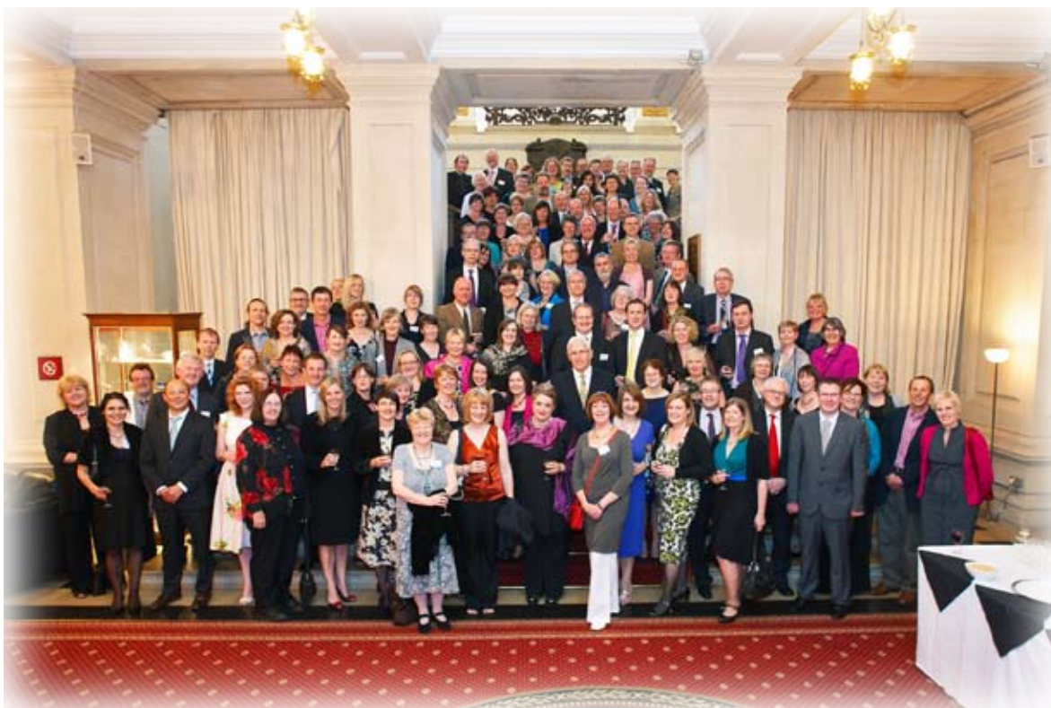
Mynychwyr cynhadledd SCONUL yng Nghaerdydd ym mis Mehefin