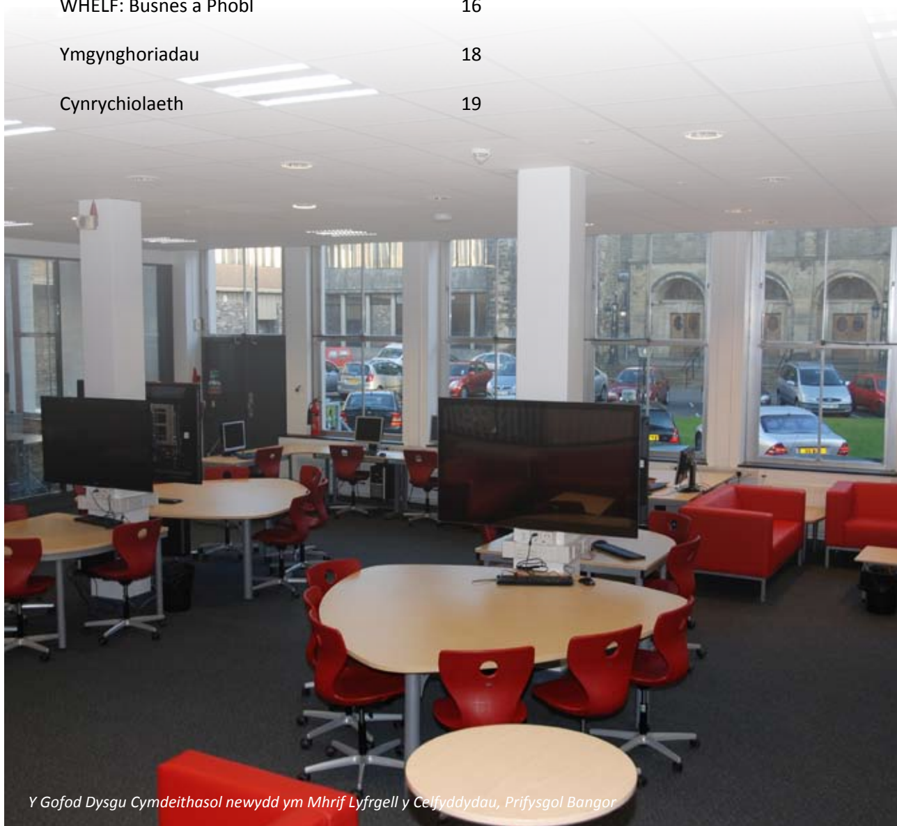
Y Gofod Dysgu Cymdeithasol newydd ym Mhrif Lyfrgell y Celfyddydau, Prifysgol Bangor